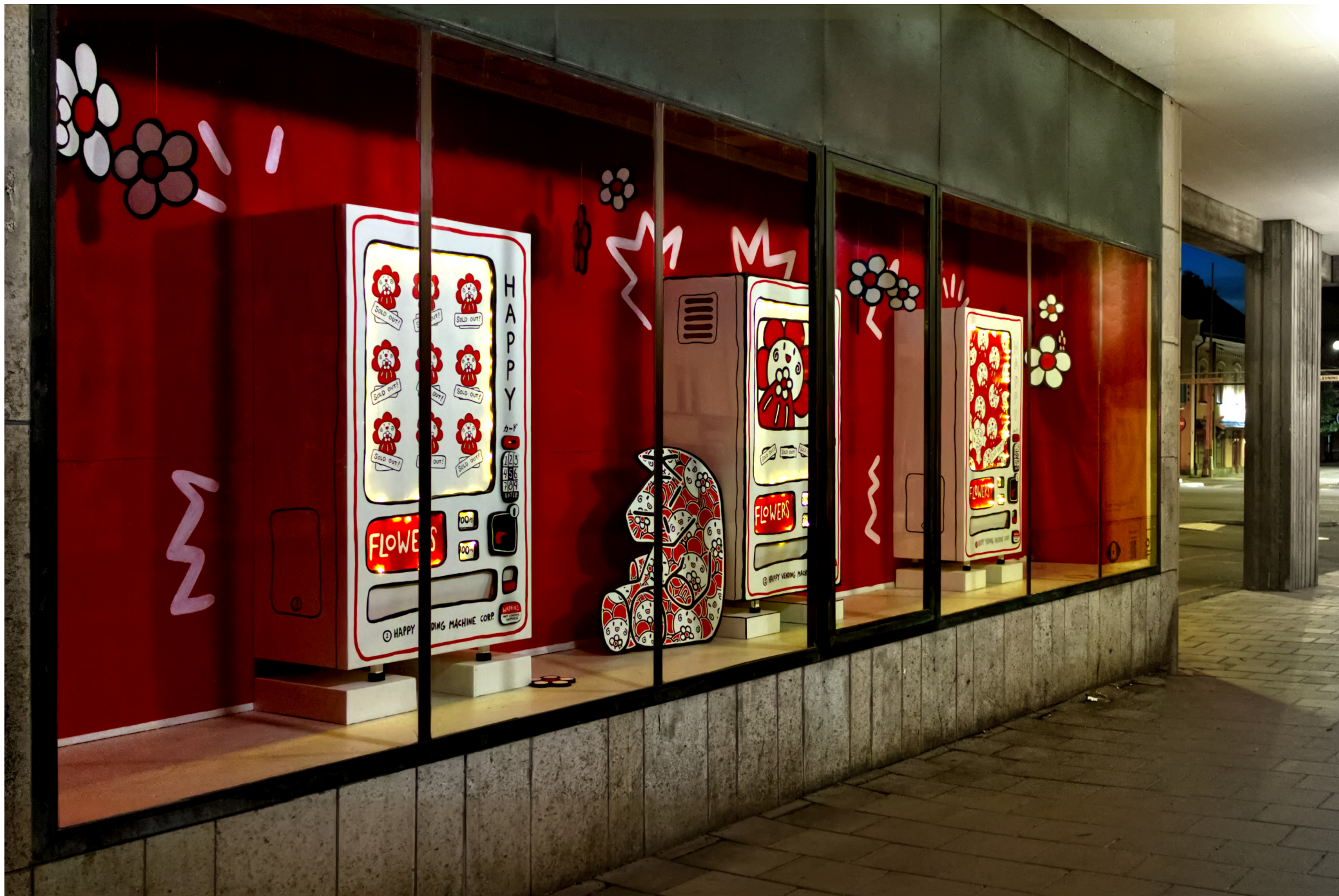
Andreas Otterberg, 2024, Happy Vending Machine Park