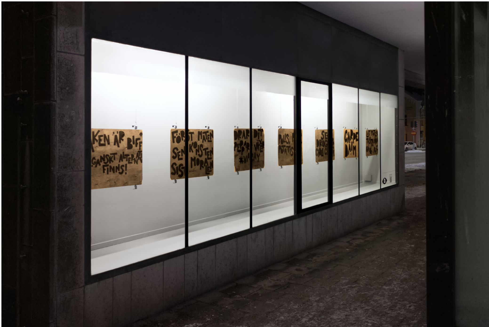
Tedde Twetman, 2025, Servera-serien